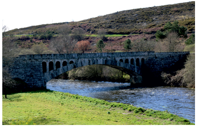
Río Limia en Ponteliñares

Desde a ponte da Ría, na estrada que desde a Sainza de Baixo cruza a a canle do Limia e a Antela ata o Rial, ata a ponte de Ponteliñares e volta. Uns 12 km de percorrido por camiño chan, nalgúns tramos pouco transitado, e 800 m por estrada completan o circuito.