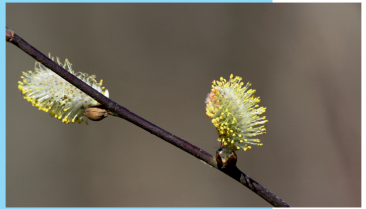
Flores masculinas de salgueiro