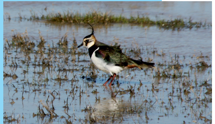
Avefría ( Vanellus vanellus ). Aínda que é máis común como invernante, sobre todo en anos fríos, aniña na Limia.