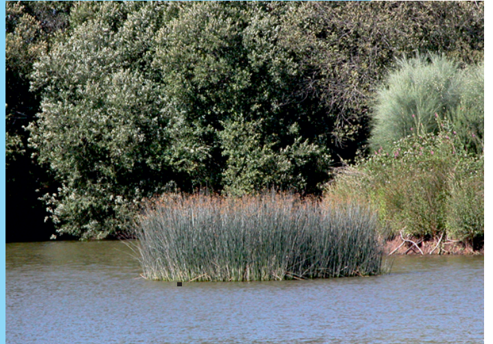
Bión ou antela ( Scirpus lacustris ). O xunco máis representativo da antiga lagoa da Antela.