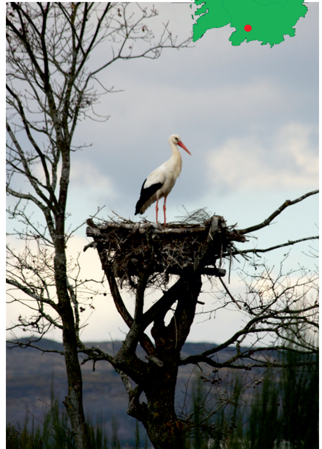
Cegoña ( Ciconia ciconia )

A importancia deste espazo reside no número de especies de aves acuáticas, esteparias e ligadas ao medio agrícola. É o último refuxio para a, noutros tempos, rica avifauna da Lagoa da Antela e acolle especies escasas ou en perigo, tanto sedentarias como visitantes. (rexistráronse 226 especies, das que 32 están catalogadas no Anexo I da Directiva Aves da UE). Tamén acolle algunhas plantas de interese como o xunco antela ( Scirpus lacustris ), que lle deu nome á lagoa, e o cardo Eryngium viviparum , declarado en perigo de extinción.